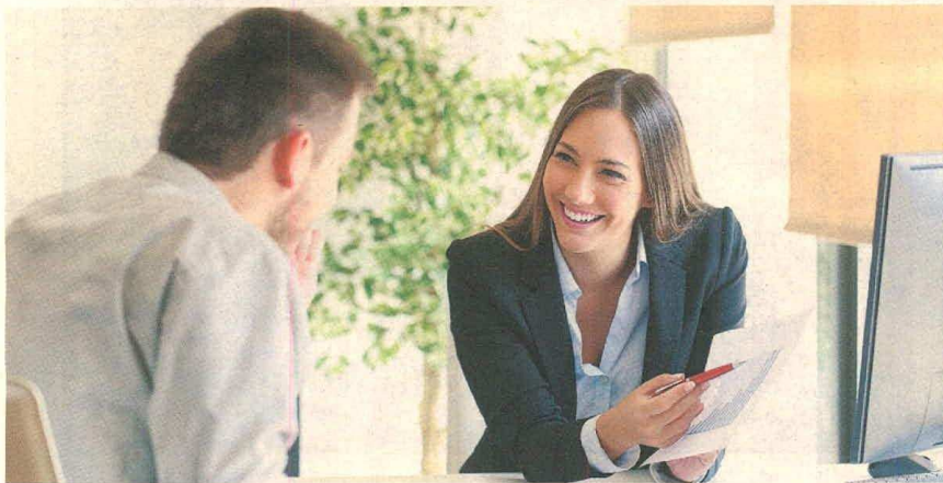
Fiducioemeva ofrece su cobertura en las 96 oficinas de Bancoomeva.